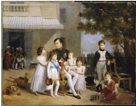
194 - L'Empereur Napoléon I er sur la terrasse du château de Saint-Cloud Louis Ducis