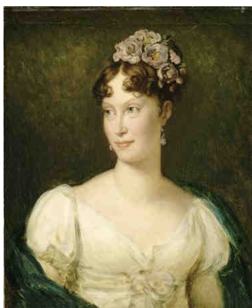
31 - Portrait en buste de l'Impératrice Marie-Louise Baron Gérard François