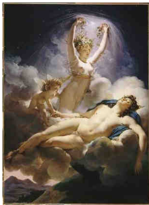
197 - L'Aurore et Céphale Pierre Narcisse Guérin (1774-1833)