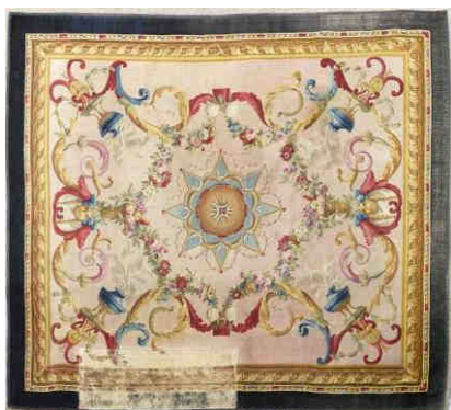
36 - Tapis turc à consoles manufacture impériale de la Savonnerie, Chaillot d'après Michel-Bruno Bellengé