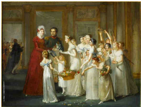
30 - Arrivée de l'impératrice Marie-Louise dans la galerie du château de Compiègne le 27 mars 1810 Pauline Auzou

Autorisation de reproduction uniquement dans le cadre d'articles faisant le compte-rendu de l'exposition