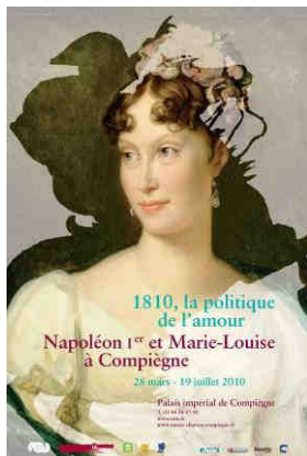
affiche de l'exposition