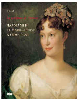
couverture du catalogue de l'exposition